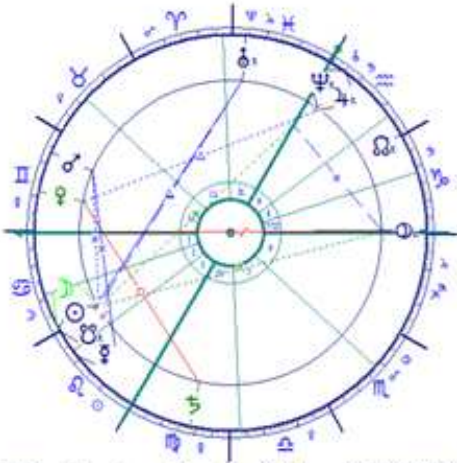
Teljes Napfogyatkozás a Rákban 2009.Júl.22.1:54 Bp.

2009. augusztusában teljesedik ki minden nyári égi üzenet: a július 22-i Napfogyatkozás után, most augusztus 6-án éjjel a Holdfogyatkozás mutat utat, merre kell haladnunk karmikus utunkon. Vajon figyelemmel voltunk-e minden történésre? Feljegyeztünk-e fontos eseményeket, amelyek utunkba sodródtak? Fontos tanácsokat küldhettek az égi világosítók!