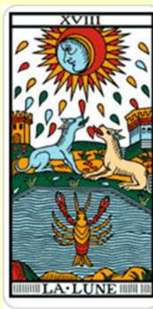
Tarot Hold (XVIII) A karmikus életet adó Víz