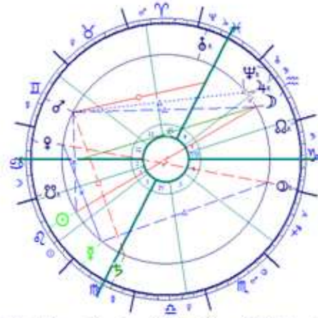
Holdfogyatkozás a Vízöntőben 2009.Aug.6.1:55 Bp.

Augusztus 6-án éjjel a Vízöntőben Holdfogyatkozás jelzi az új időszámítás kezdetét az emberek és az ország lakossága számára, új idő közeleg a lelkiségében gyermek, karma vizén utazó emberek életében. A Napfogyatkozás a Rák jegyében volt, ami mutathat egyrészt baljós jelet a vízi környezet szennyeződésére, halak és apró madarak pusztulására, természeti környezeti katasztrófa, járványok lehetőségére, és meginog a kormányzás magabiztossága is . A Vízöntő jegyében bekövetkező augusztusi Holdfogyatkozás a mezőgazdasági területek pusztulását hozhatja, és kedvezőtlen hatású társadalmi átalakulások előjele is hosszú hatású folyamatként. Ám hiába tudjuk a fogyatkozási időpontokról, hogy elsősorban valaminek az elmúlását indíthatják be – ez az „elromlás”, üresedés, még a szerencsétlenségek is, valaminek a kezdetét hozhatják meg! Könnyebb haladni a karmikus sors hullámain, ha azt keressük: miben segítenek a jelek, merre akar terelni a szimbólumok világa. A Vízöntő Holdfogyatkozás elsősorban a költségek drámai csökkentését követelik meg országos és családi kassza szintjén is , hirtelen, de szükségszerű reformokkal lehet kezelni a felmerülő helyzeteket. Gyors megvilágosodásokra van szükség, merre lehet tovább menni: kövessük a jelek támogató iránymutatását, merre engedtetik menni. Akinek Napja, Holdja, vagy Ascendense Vízöntő jegyben áll, biztosan számíthat a változtatnivalók hirtelen felbukkanására – a saját születési horoszkóp ház, mint életterület helyszínén és feladatkörében.