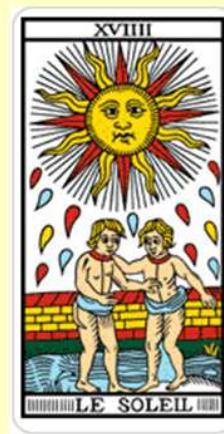
Tarot Nap (XIX) A szellemi szikrát vető Nap